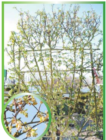
О Яблоне декоративной на шпалере Evereste читайте на стр. 3.

Садовому центру «Зеленый дом» требуются: